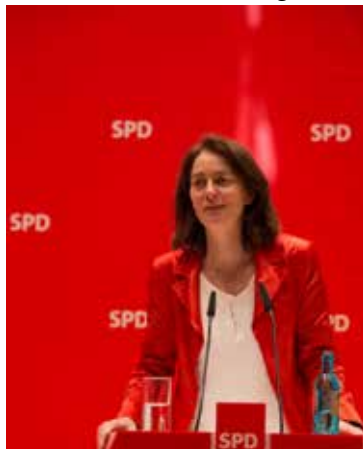
Katharina Barley bei der AGS-Bundeskonferenz am 30.04.16

Mit Ihrer Spende unterstützen Sie die Arbeit der AGS auf Bundesebene und helfen, dass wir die Interessen der Selbständigen sowie der kleinen und mittleren Unternehmen noch besser vertreten können. Wir organisieren Veranstaltungen für Selbständige und Mittelständler. Wir schaffen Diskussionsplattformen und sorgen für eine bessere Vernetzung unserer Interessen.