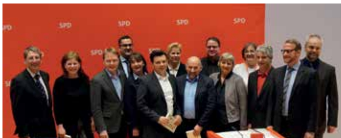
Der Bundesvorstand der Arbeitsgemeinschaft Selbständige in der SPD (AGS)

komm. Bundesvorsitzender Arbeitsgemeinschaft der Selbständigen in der SPD (AGS)